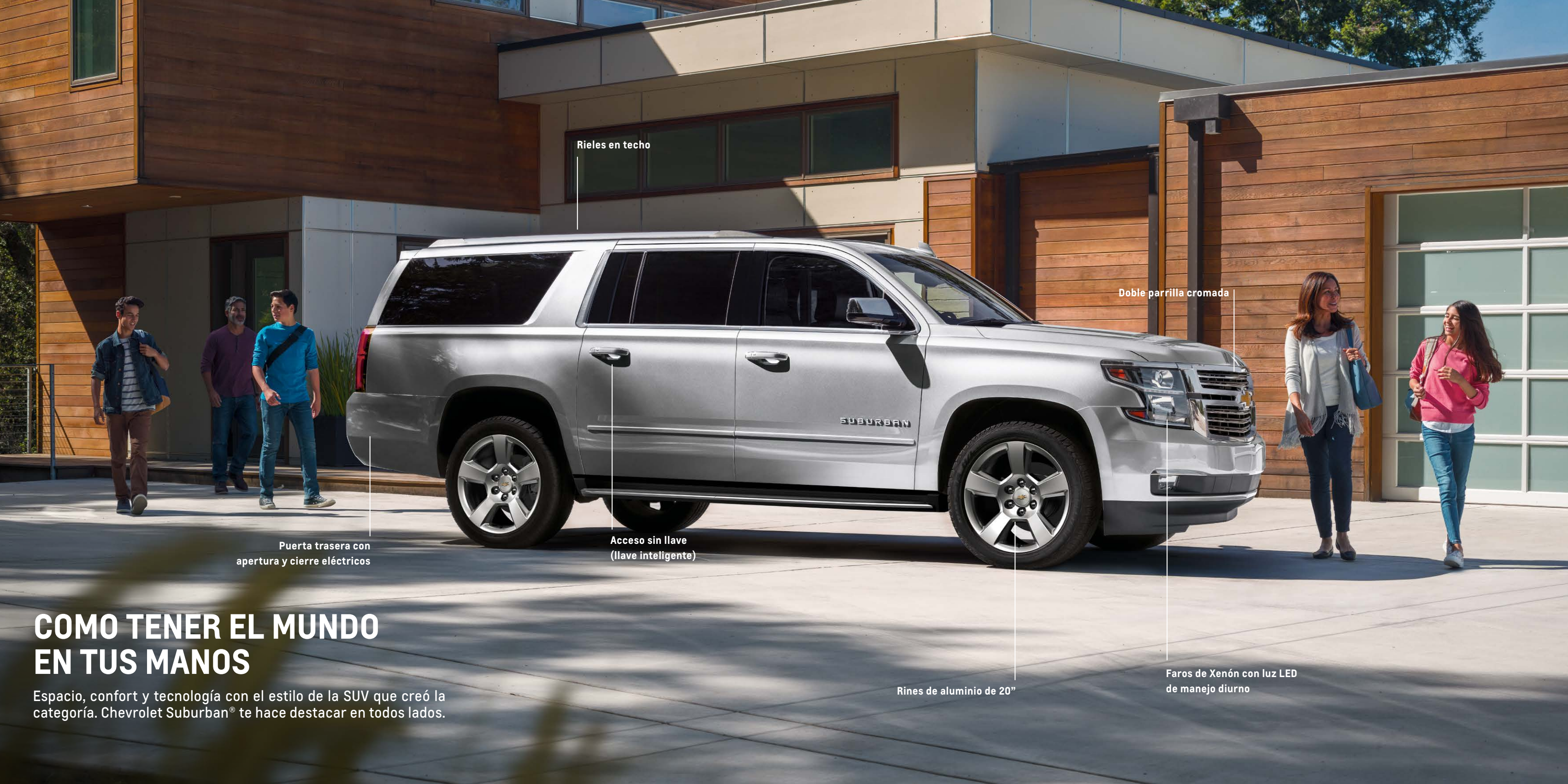
Rieles en techo